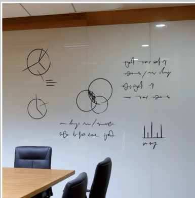
Cloison et tableau